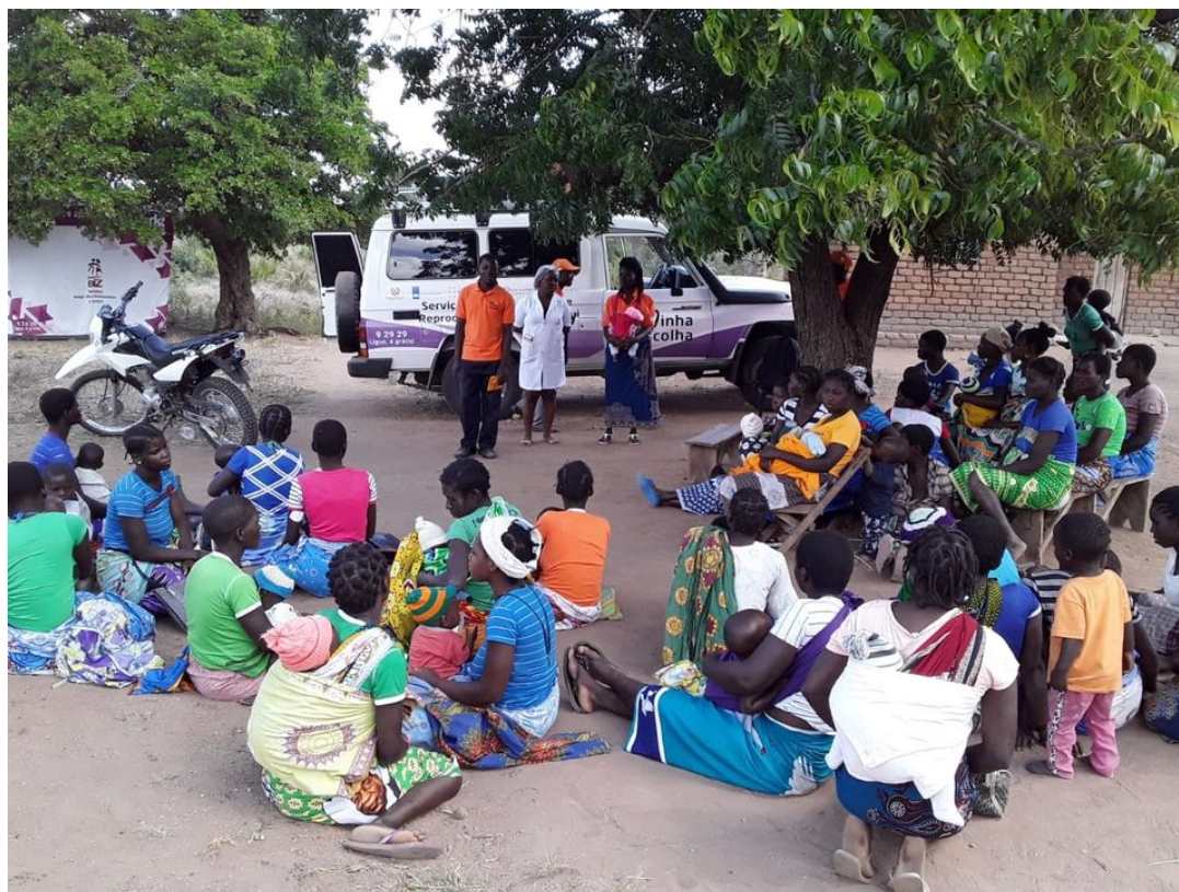
Utbildning i Mocambique.

När covid-19 sprider sig bland de fattigaste och mest utsatta är det inte bara själva viruset som hotar människors liv och hälsa. De stängda gränserna och det fokus som läggs på att bekämpa covid-19 slår mot flera andra hälsoområden. Sida går därför in med ett extra stöd på 20 miljoner kronor för att förbättra tillgången till preventivmedel, abortprodukter och rådgivning i östra och södra Afrika.