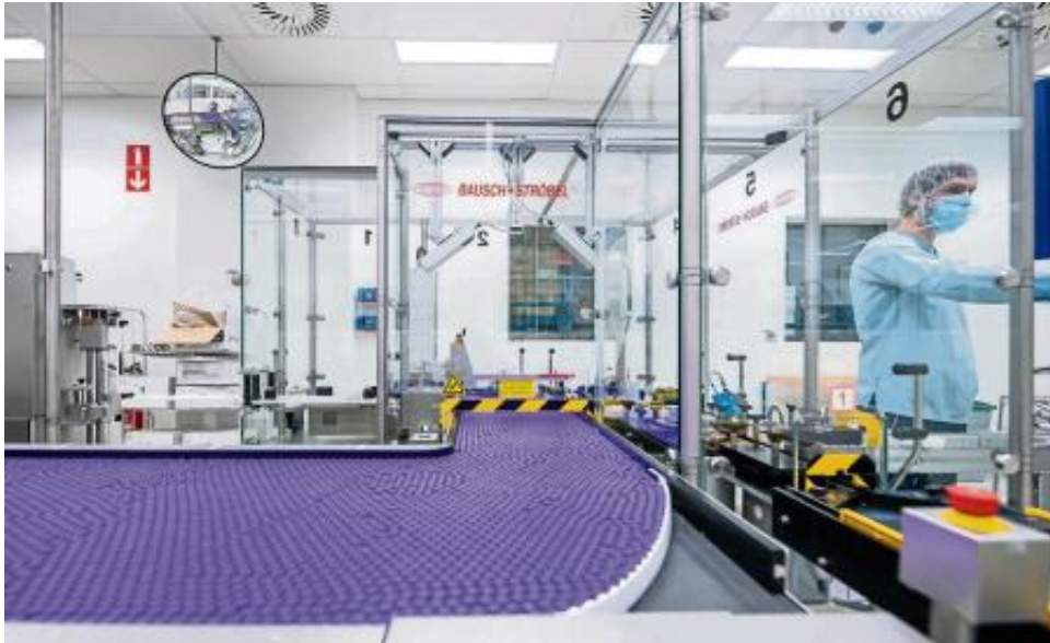
Fabbrica Pfizer a Puurs (Belgio)