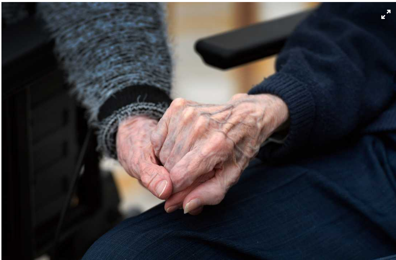
Arkivbild från äldreboende.