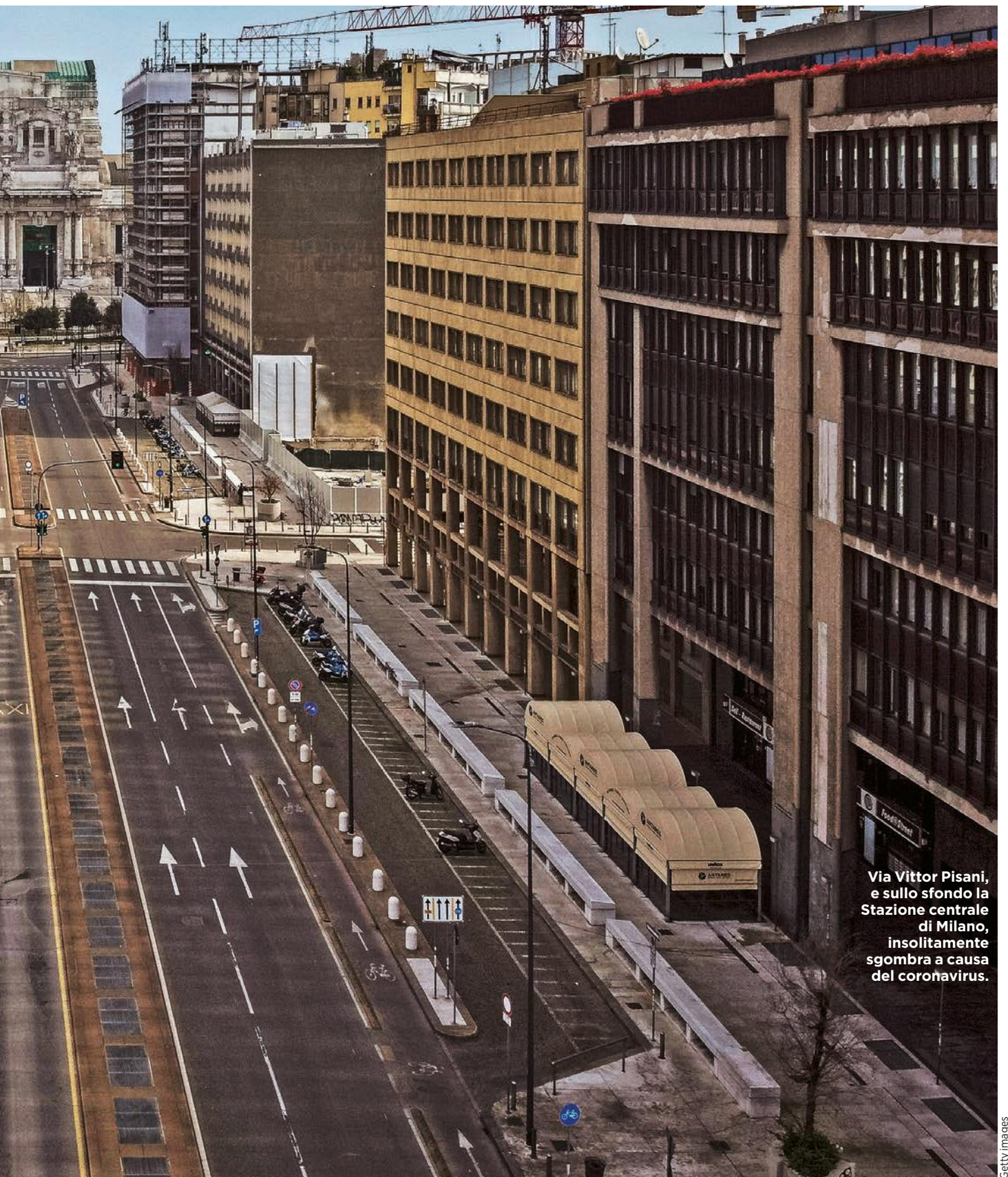
Via Vittor Pisani, e sullo sfondo la Stazione centrale di Milano, insolitamente sgombra a causa del coronavirus.