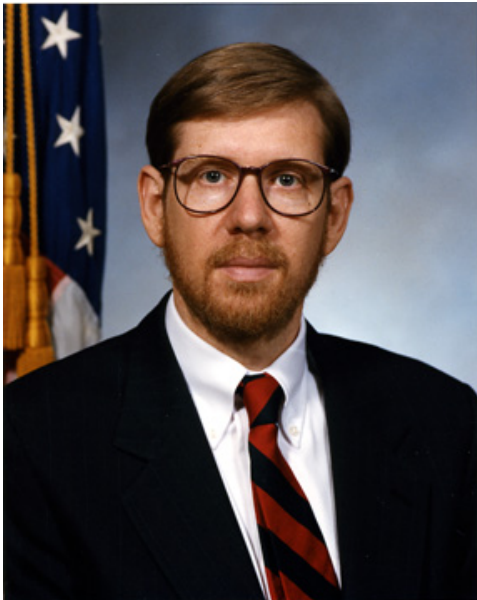
David Kessler, ex commissario della FDA, è stato fondamentale per portare la pillola abortiva negli Stati Uniti

Nel 1996, sotto la direzione di Kessler, un comitato consultivo della FDA aveva ritenuto il farmaco "sicuro ed efficace" per le donne americane al termine degli studi clinici. A Family Research Council (FRC) Relazione del processo ha preso atto dei conflitti con gruppo consultivo di Kessler. Live Action News in precedenza ha dettagliato il processo segreto e parziale che circonda l'approvazione della pillola e ha sottolineato come la FDA di Kessler abbia politicizzato il processo di approvazione della pillola abortiva scegliendo di non pubblicare i nomi degli "esperti" che hanno esaminato il farmaco. La pillola abortiva è stata infine approvata dalla FDA nel 2000, dopo che Kessler si era dimesso dal suo incarico.