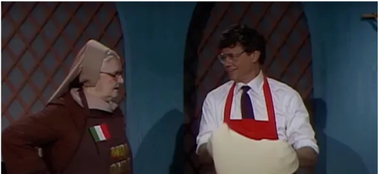
Thomas Monaghan, fondatore di Domino's Pizza, parla con Madre Angelica a EWTN.

Tuttavia, la strategia di marketing che avrebbe cambiato il corso della sua vita era la sua garanzia ai clienti che avrebbero ricevuto una pizza calda in 30 minuti o avrebbero ripreso i loro soldi.