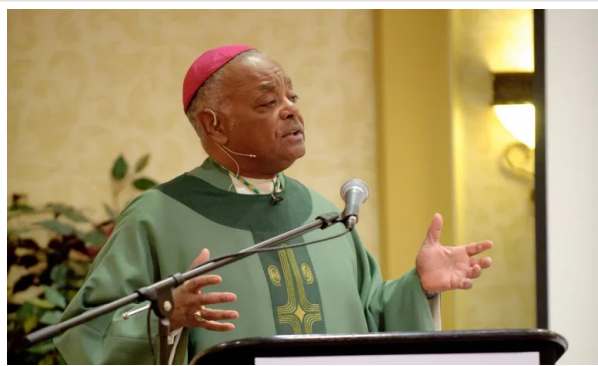
Arcivescovo Wilton Gregory

30 agosto 2019 / 8 Commenti / in Gerarchia , Vita parrocchiale e cura pastorale , Transgender , Non categorizzato / di Robert Shine, caporedattore