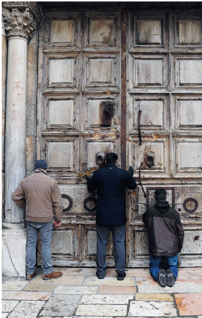
SPERANZA Preghiera davanti alle porte chiuse della chiesa del Santo Sepolcro a Gerusalemme

In questo momento il cattolicesimo è diventato una religione molto carina, tutta panna montata e zucchero filato, fatta di pretini molto graziosi che raccomandano ingresso nelle loro chiese solo ai vaccinati e di vescovi che hanno