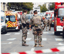
PAURA Militari a Parigi dopo l'attentato

Francese si converte all'islam e fa strage a coltellate tra i colleghi della prefettura